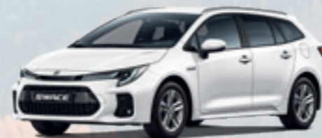
NEW SWACE FULL-HYBRID