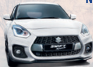
NEW SWIFT SPORT HYBRID