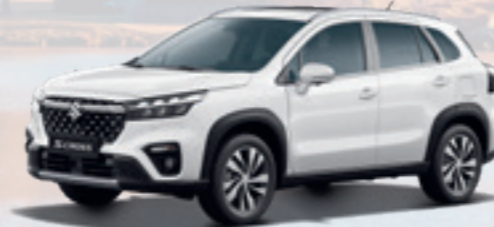
NEW S-CROSS FULL-HYBRID