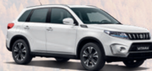
NEW VITARA FULL-HYBRID