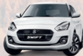
NEW SWIFT HYBRID