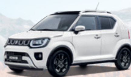
NEW IGNIS HYBRID