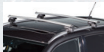
Barres de toit en aluminium

Le tube en aluminium des barres de toit dispose d'un profil en T et peut être verrouillé.