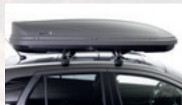
Coffre de toit MODULA 500L dès Fr. 498.-

Dimensions extérieures: 139 x 89.5 x 39cm