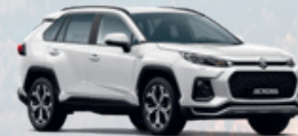
NEW ACROSS PLUG-IN-HYBRID