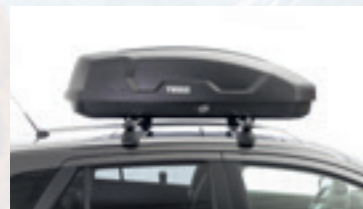
Coffre de toit THULE 300L dès Fr. 546.90

Les coffres de toit spacieux de Suzuki existent en différentes variantes. Ils sont faciles à utiliser et sont des compagnons de voyage idéaux.