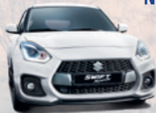
NEW SWIFT SPORT HYBRID