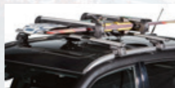
Porte-skis et porte-snowboards

Pour quatre paires de skis ou deux snowboards dès Fr. 162.-