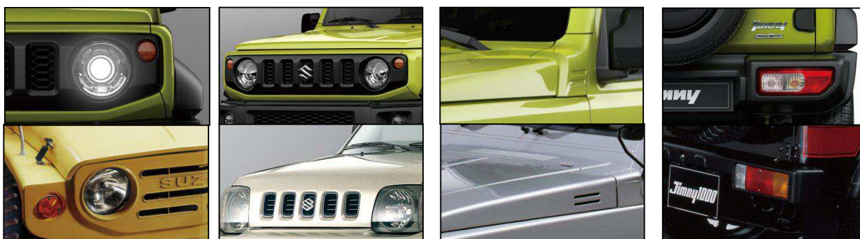
Phares circulaires et clignotants séparés