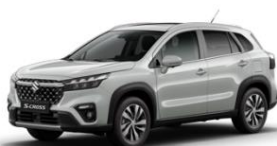
Silky Silver Metallic

Le nouveau S-CROSS est disponible en huit coloris afin de répondre aux goûts d'un large panel de conducteurs de SUV. Parmi les coloris métallisés figurent le Titan Dark Gray, le Cosmic Black et le Canyon Brown. Les coloris nacrés incluent, quant à eux, le Cool White, l'Energetic Red et le Sphere Blue. Les teintes Silky Silver Metallic et White viennent compléter cette palette de coloris.