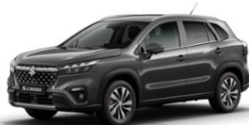
Titan Dark Gray Pearl Metallic