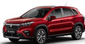
Energetic Red Pearl