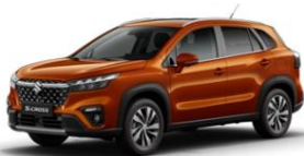
Canyon Brown Pearl Metallic