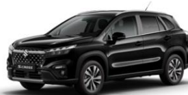
Cosmic Black Pearl Metallic