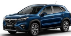
Sphere Blue Pearl