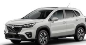
Cool White Pearl