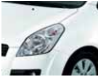
Superior White (26U)