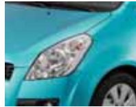
Splash Turquoise Blue Metallic (ZKC)