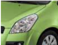
Splash Green Metallic (ZJD)