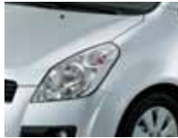
Silky Silver Metallic (ZCC)