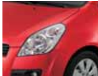
Bright Red (ZCF)