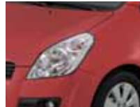
Sunlight Copper Metallic (ZFS)