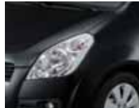
Cosmic Black Metallic (ZCE)