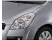
Galactic Gray Metallic (ZCD)